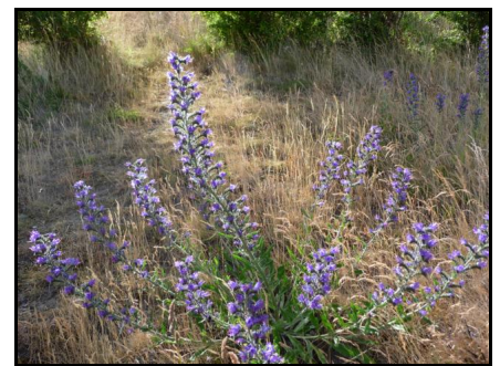
Natternkopf ( Echium vulgare ) an der Sundbrücke, eine in Schleswig-Holstein gefährdete Art