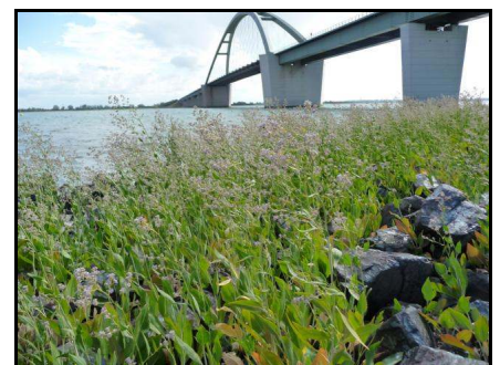
Breitblättrige Kresse ( Lepidium ruderales ) im Strandbereich des Sundes

Auftraggeber: LBV-SH, Niederlassung Lübeck