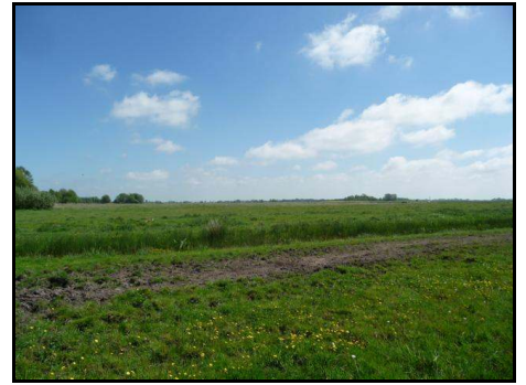
Grünlandmarsch an der B 5 zwischen Husum und Tönning; Lebensraum gefährdeter Wiesenvögel

Florist.-faunistische Kartierungen Vegetationskundliche Kartierungen FFH-Lebensraumtypen Artenschutzrechtlicher Fachbeitrag