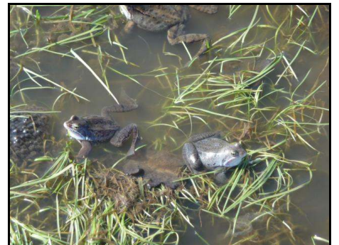
Der Moorfrosch ist die charakteristische Amphibienart der Marsch

Auftraggeber: LBV-SH, Niederlassung Flensburg